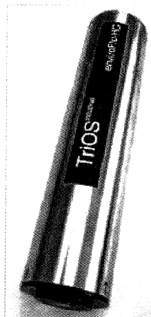
Рисунок 1 – Общий вид анализатора полиароматических углеводородов в воде enviroFlu-NC