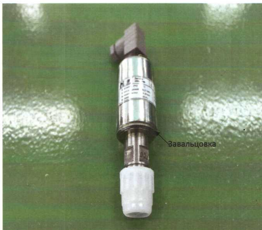
Рисунок 2 – Место завальцовки