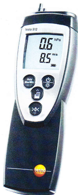
Фото 1 - Измерители дифференциального давления TESTO 312, TESTO 512