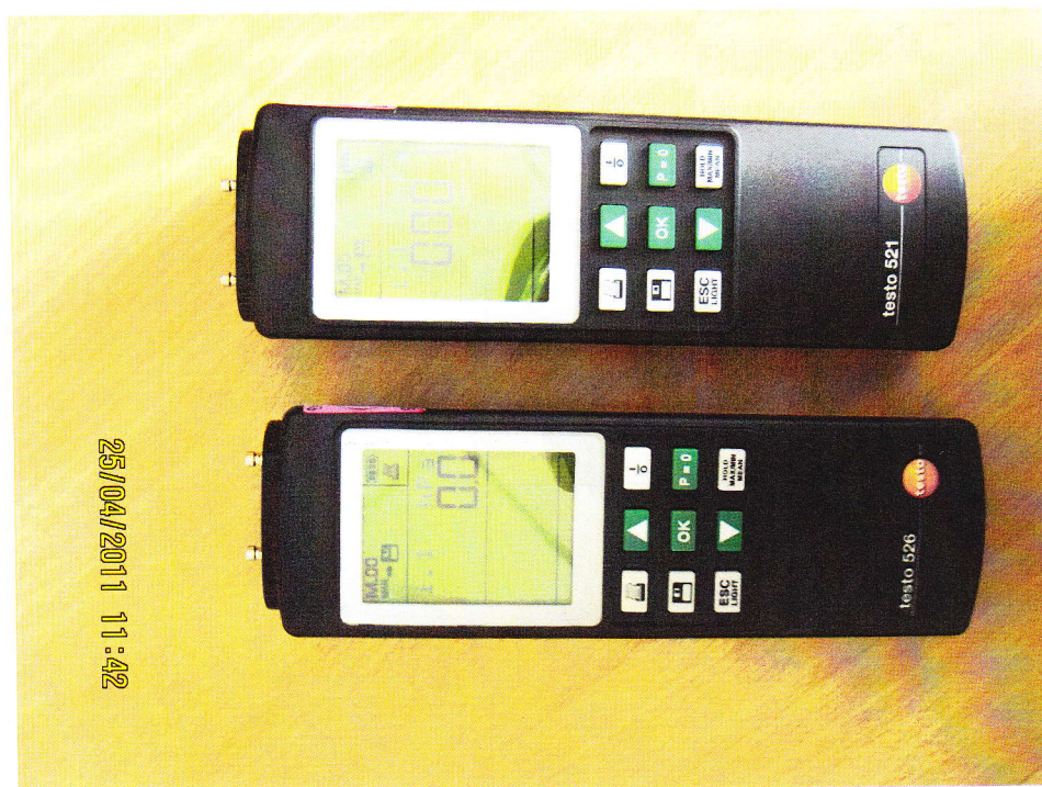
Фото 3 - Измерители дифференциального давления TESTO 521, TESTO 526