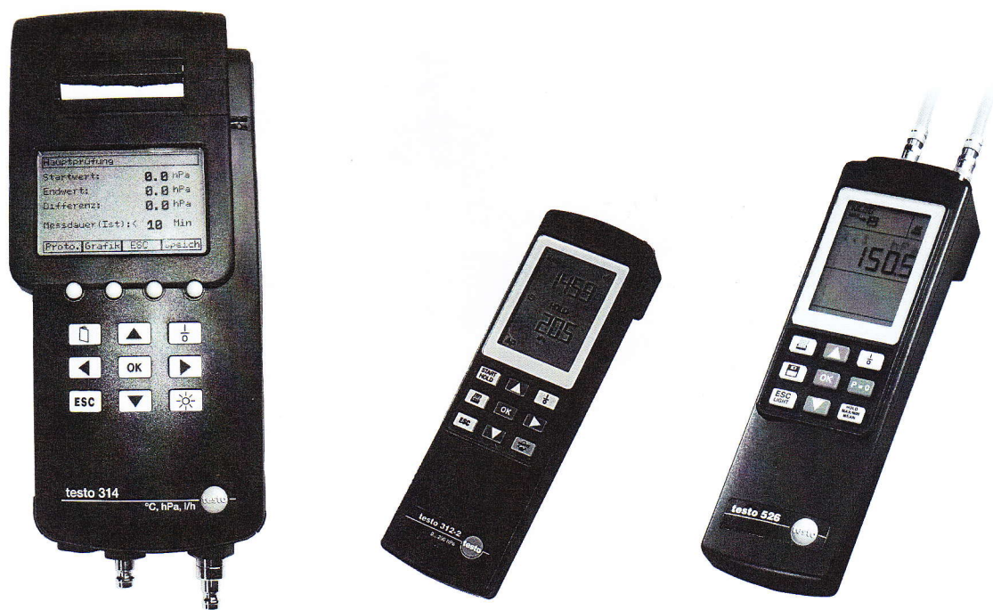
Фото 2 - Измерители дифференциального давления TESTO 314, TESTO 312, TESTO 526